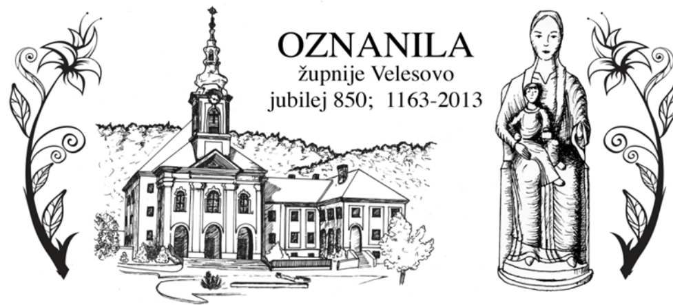
Grafika: Sabina Zorman

Izdal in odgovarja: Slavko Kalan, župnik; tel: 04/25-28-500 ali 041/755-404 e-naslov: slavko.kalan@rkc.si; Župnijska spletna stran: www.zupnija-velesovo.si