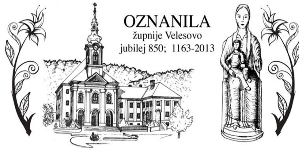
Grafika: Sabina Zorman

Župnija Velesovo, Adergas 1, 4207 Cerklje na Gor. Izdal in odgovarja: Slavko Kalan, župnik; tel.: 25-28-500 ali 041/755-404 elektronski naslov: slavko.kalan@rkc.si ŽUPNIJSKA SPLETNA STRAN: www.zupnija-velesovo.si ŽUPNIJSKI TRR: SI 56 0433 1000 3327 797