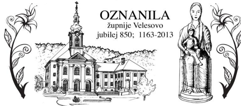
Grafika: Sabina Zorman

Izd al in Odgovarja: Slavko Kalan, župnik; tel: 25-28-500 ali 041/755-404 elektronski naslov: slavko.kalan@rkc.si; ŽUPNIJSKA SPLETNA STRAN: www.zupnija-velesovo.si