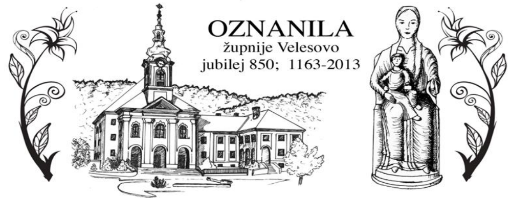
Grafika: Sabina Zorman

- 22. 6. in 23. 6. ter 29. 6. in 30. 6. ob 20.30 na samostanskem dvorišču duhovni misterij » THEOPHILUS in ANIMA «