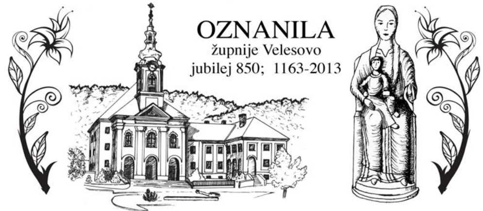
Grafika: Sabina Zorman

Izdal in Odgovarja: Slavko Kalan, župnik; tel: 25-28-500 ali 041/755-404 elektronski naslov: slavko.kalan@rkc.si ; ŽUPNIJSKA SPLETNA STRAN: www.zupnija-velesovo.si