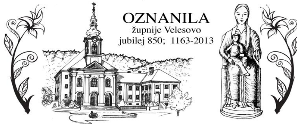
Grafika: Sabina Zorman

Izdal in Odgovarja: Slavko Kalan, župnik; tel: 25-28-500 ali 041/755-404 elektronski naslov: slavko.kalan@rkc.si ; ŽUPNIJSKA SPLETNA STRAN: www.zupnija-velesovo.si