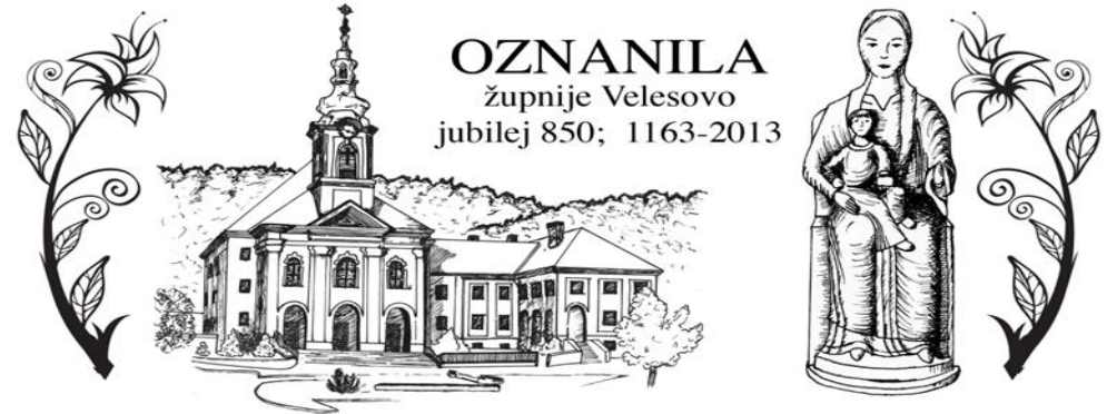
Grafika: Sabina Zorman

Izdal in Odgovarja: Slavko Kalan, župnik; tel: 25-28-500 ali 041/755-404 elektronski naslov: slavko.kalan@rkc.si; ŽUPNIJSKA SPLETNA STRAN: http://zupnija-velesovo.si