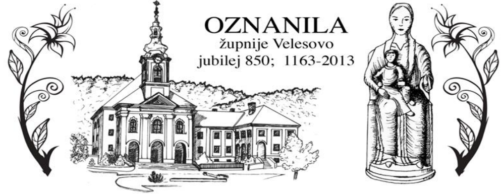
Grafika: Sabina Zorman

Izdal in Odgovarja: Slavko Kalan, župnik; tel: 25-28-500 ali 041/755-404 elektronski naslov: slavko.kalan@rkc.si; ŽUPNIJSKA SPLETNA STRAN: www.zupnija-velesovo.si